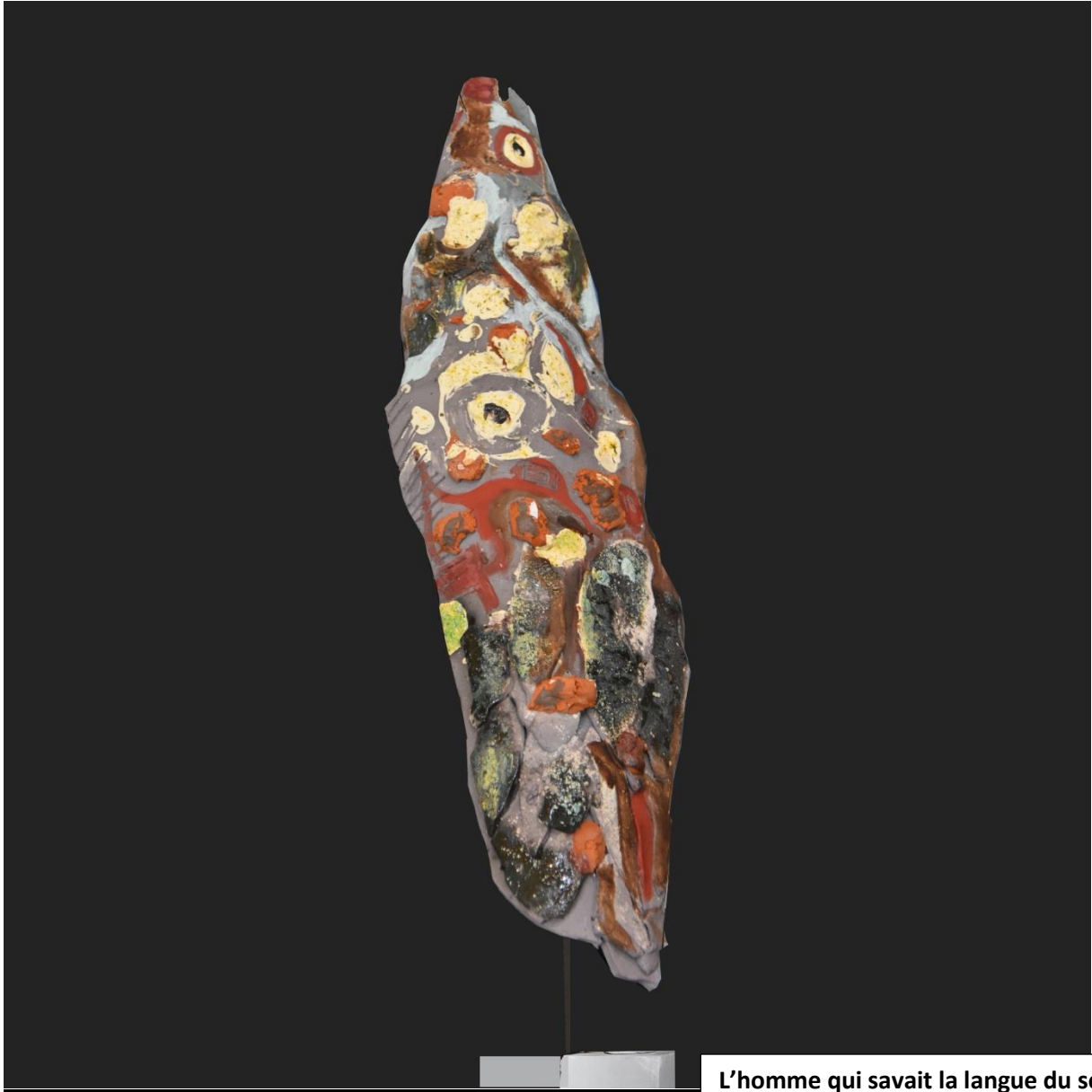
L'homme qui savait la langue du serpent 3 , grès, 60x3x15. Sculpture sur pied. 2018.