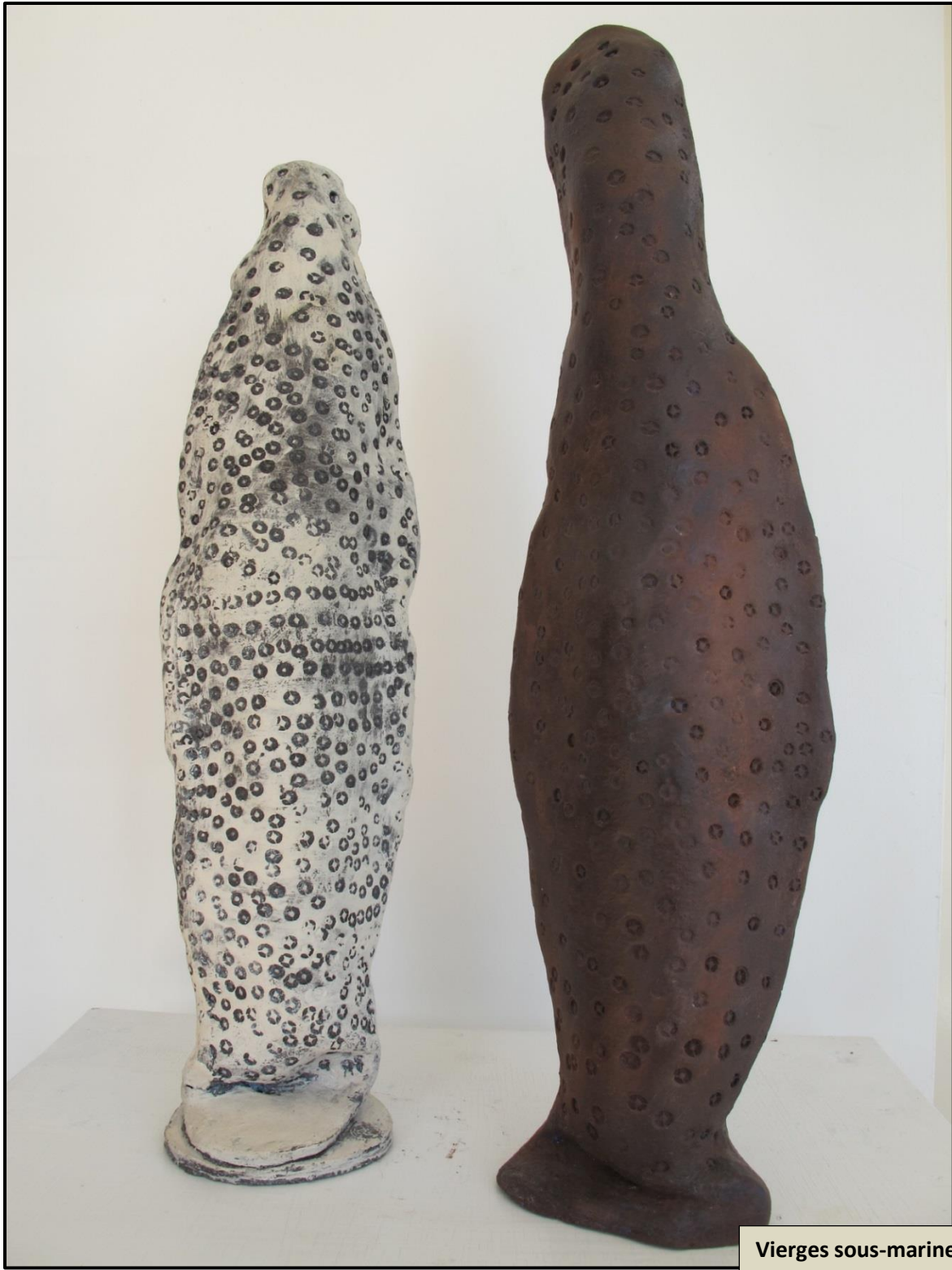
Vierges sous-marines , terre à faïence, engobes.70x19x8 cm, 2016