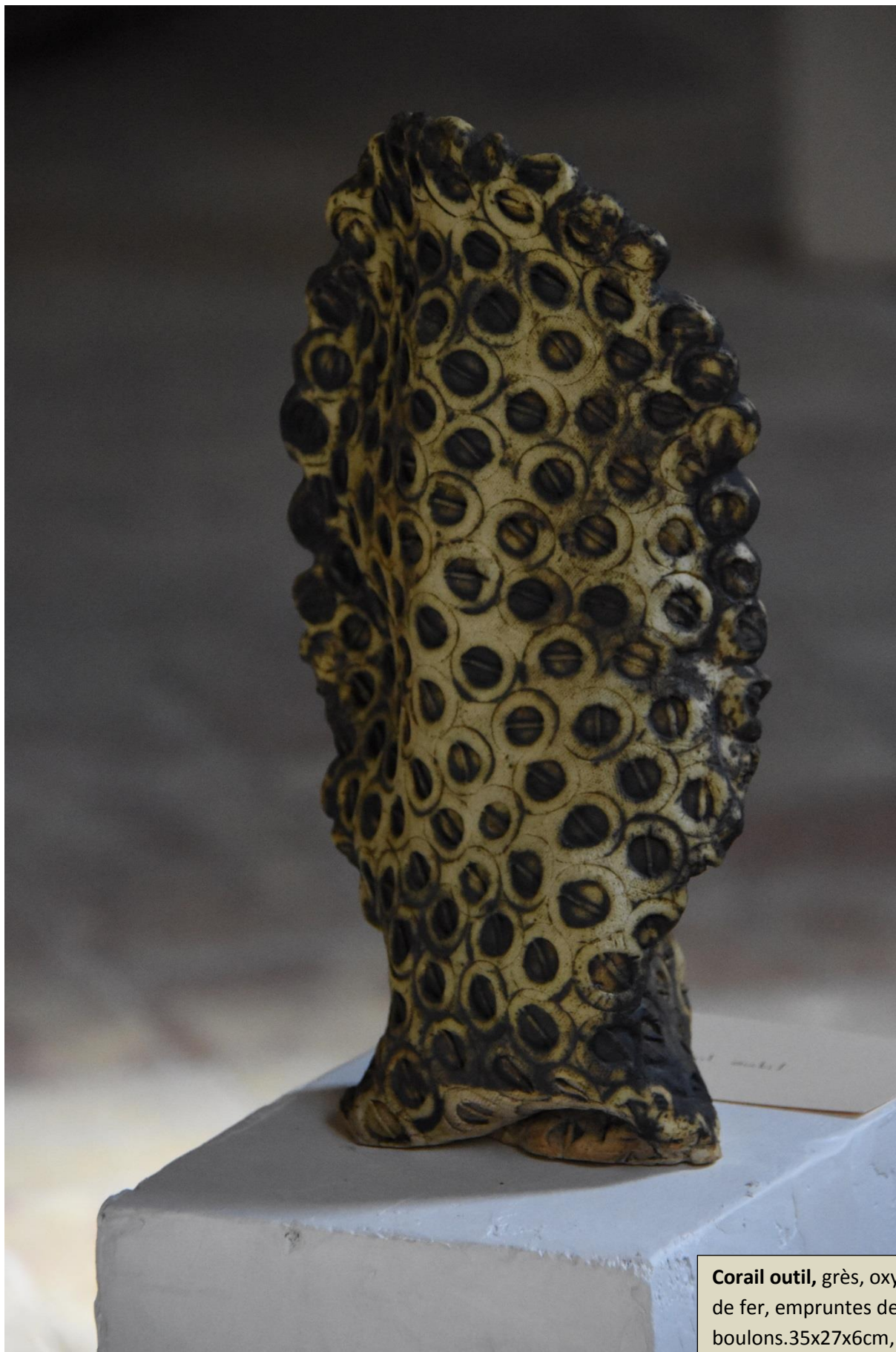
Corail outil , grès, oxyde de fer, empruntes de boulons. 35x27x6cm, 2014