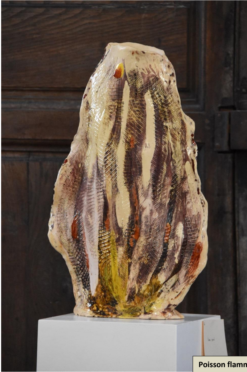
Poisson flamme , faïence, oxydes de fer rouge. 70x23x8 cm, fin 2017