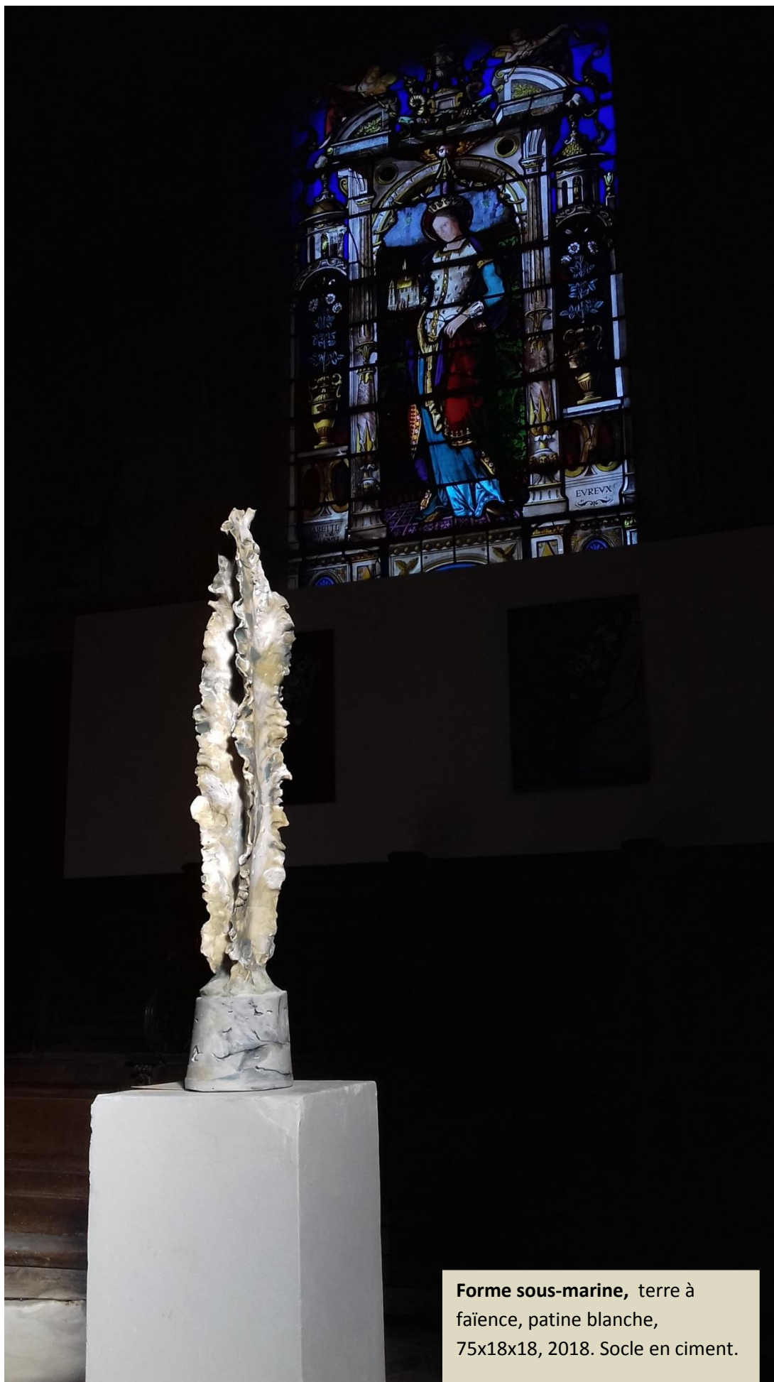
Forme sous-marine , terre à faïence, patine blanche, 75x18x18, 2018. Socle en ciment.