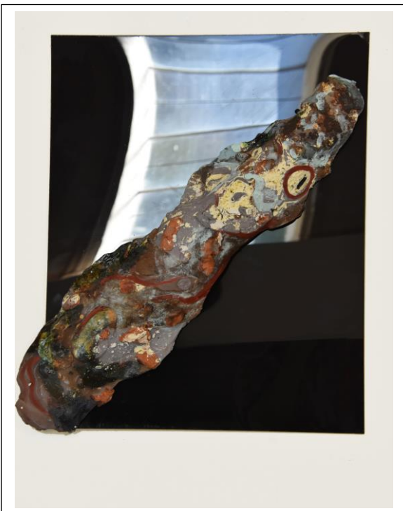
L'homme qui savait la langue du serpent 1 1/4 de la série sculptures murales sur plexiglass / grès, 60x3x15. 2018.