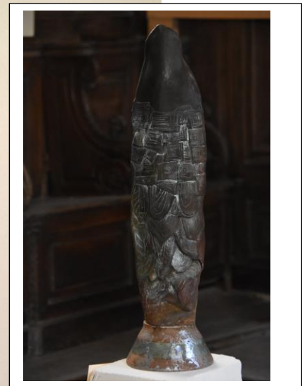
Idée de Nature, terre à faïence, patine, oxyde de cuivre et bols retournés. 70x18x18. Fin 2017