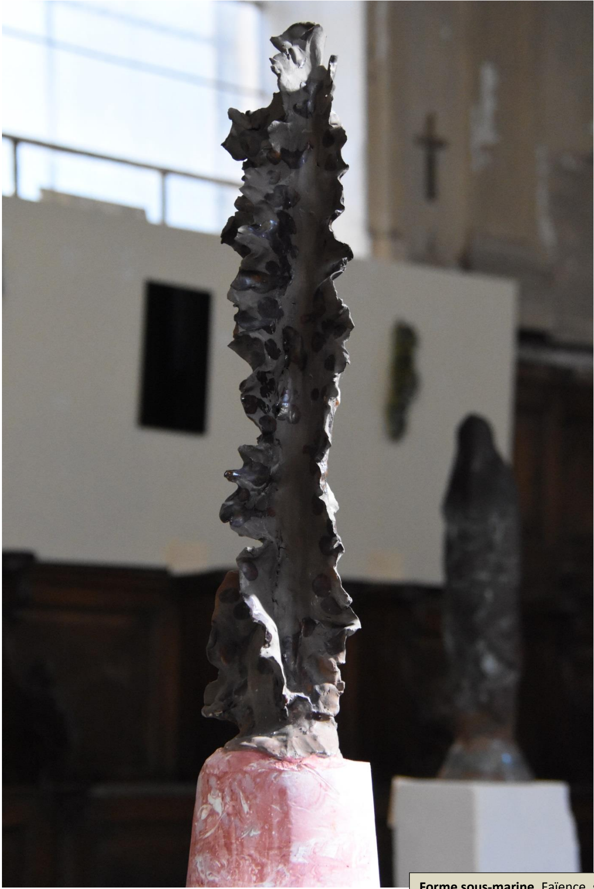
Forme sous-marine. Faïence. socle ciment. 74x18x18. Fin 2017